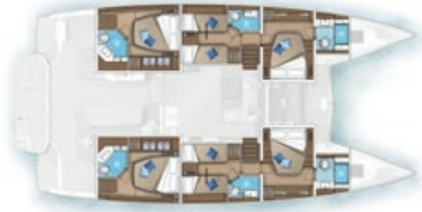
6 cabines - 6 salles d'eau 6 cabins - 6 heads