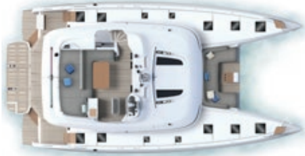
Flybridge & Pont - Configuration standard Flybridge & Deck - Standard configuration