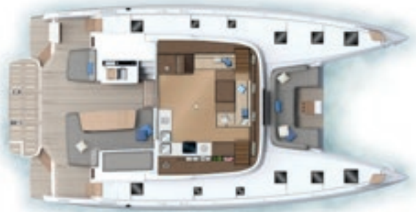
Carré - Versions 6 cabines Saloon - 6 cabin version