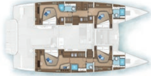
4 cabines - 4 salles d'eau 4 cabins - 4 heads