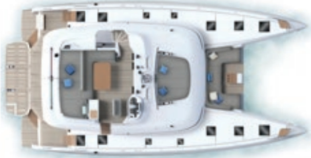
Flybridge & Pont Zone de bains de soleil avant (option) - Accès tribord (option) Flybridge & Deck Optional forward sunbathing area - Optional starboard access