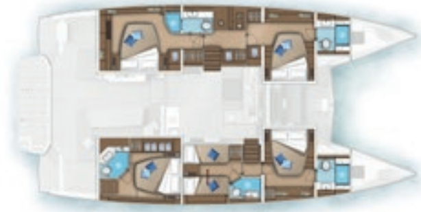
5 cabines - 5 salles d'eau 5 cabins - 5 heads