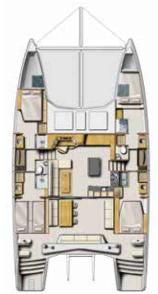
Version 4 Cabines ( Cuisine en îlot ) 4 Cabin Version ( Island shape galley )