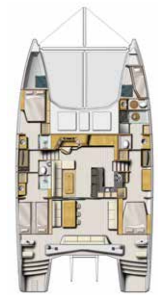
Version propriétaire 3 Cabines + skipper ( Cuisine en U ) Owner version 3 Cabin + skipper ( U shape galley )

CATANA sources from only the best equipment suppliers and manufacturers for the interior finish, enabling us to offer you the very best of our products combined with CATANA know-how. A team of professionals is at your disposal to help you design your own interior layout so that you will feel right at home on board your unique boat. Performance, safety, longevity, innovation, standard of finish, attention to detail, such are the main characteristics and values of a CATANA.