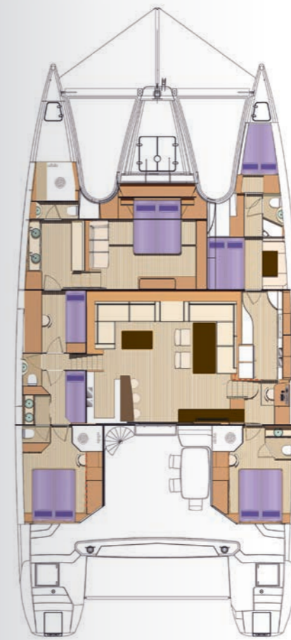
Version personnalisée Custom version